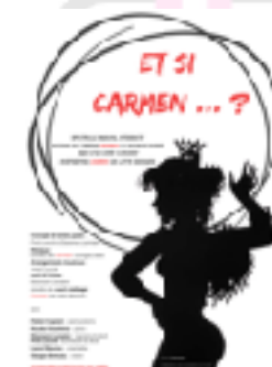
Et si Carmen ... ?