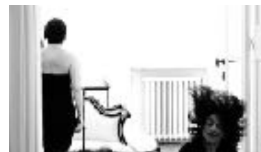
Comme des Oiseaux