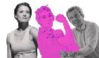
En avant mesdames !