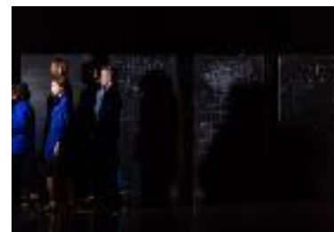
Dans un train / ВАГОН-ЗАК